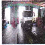
Foto Belakang Image Rear